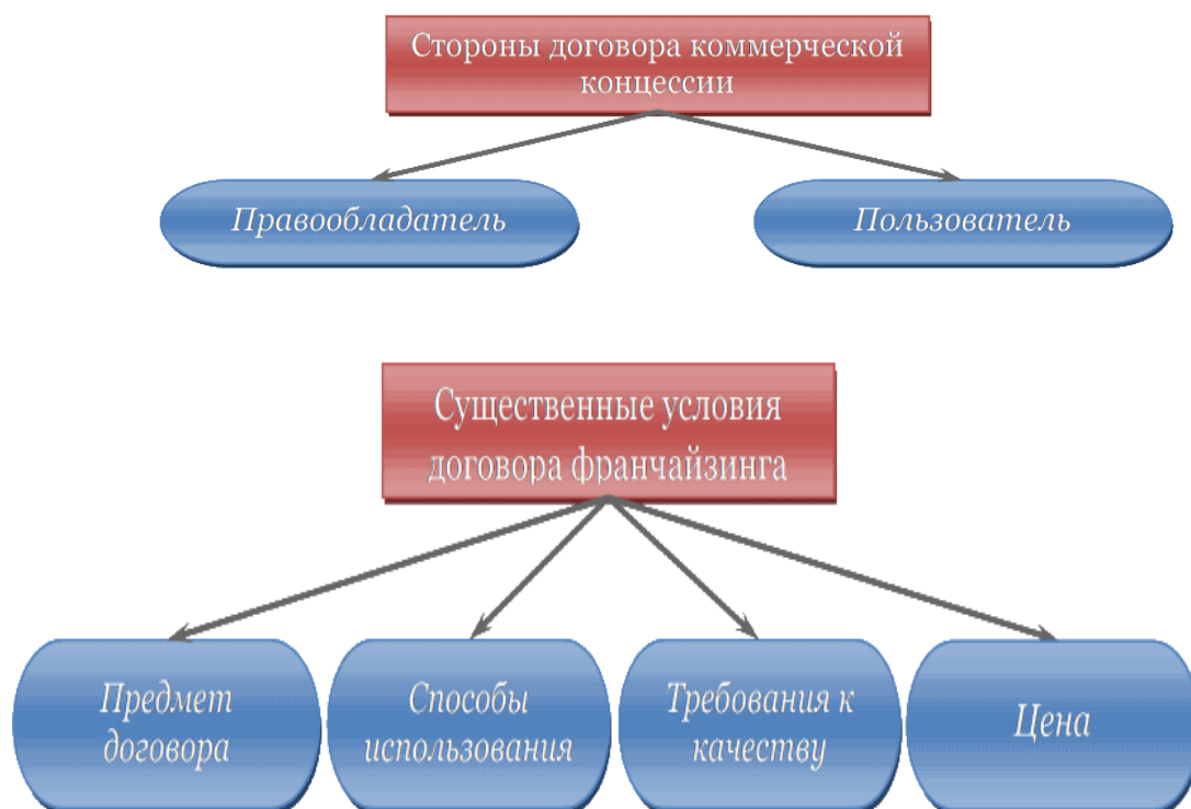
Рисунок 3 – Содержание договора коммерческой концессии

Нумерация листов курсовой работы должна быть сквозной для текста и приложений, начиная с титульного листа. Проставляется нумерация с третьего листа (титульный лист и задание не нумеруются). Номер листа проставляется в справа внизу шрифтом Times New Roman.